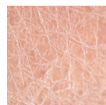
Xerózy způsobené onkologickou léčbou

1 až 2 aplikace denně - Obličej a tělo - Kojenci, děti, dospělí