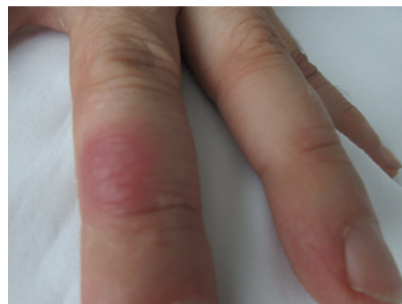
Obr. 3. Stav po zhojení morfy orfu na 3. prstě levé ruky

sloratidine tbl 5 mg ráno a večer, lokálně bylo doporučeno ošetřovat primární morfu povidon jodinátem a kryt náplastí. Na morfy na těle doporučen 1× denně metylprednisolon aceponid v mléku, kůži nemydlit. Kontrola druhý den telefonická, při progresi plánováno nasazení perorálního kortikoidu. Telefonická konzultace s pacientem po 1 dni: Po ošetření morf